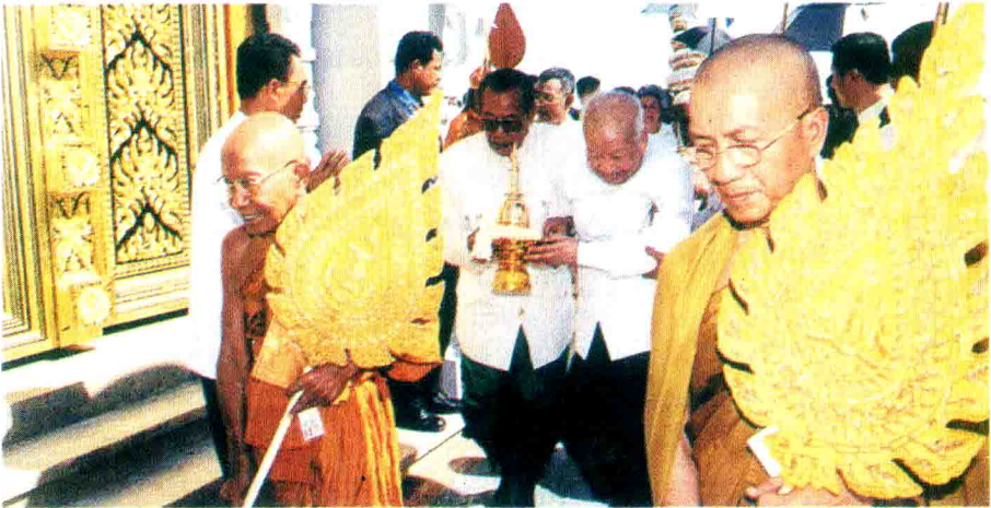
ព្រះមហាក្សត្រ និង សម្តេចព្រះរាជអគ្គមហេសីជទីសក្ការៈ យាងដង្ហែព្រះបរមសារិកធាតុនៅព្រះសក្យមុនីចេតិយ