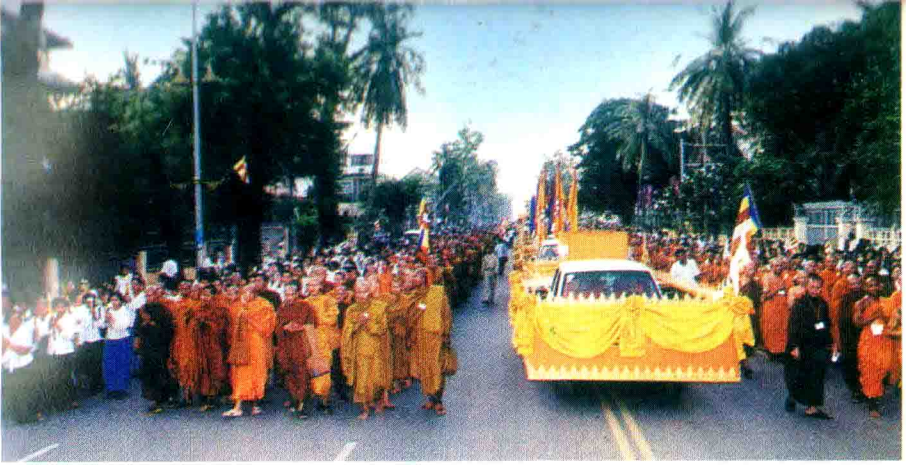
ពិធីដង្ហែព្រះបរមសារិកធាតុ