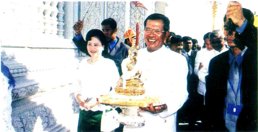
សម្តេច ហ៊ុន សែន និង លោកស្រី ដង្ហែព្រះពុទ្ធបដិមាករទៅតម្កល់នៅព្រះសក្យមុនីចេតិយ