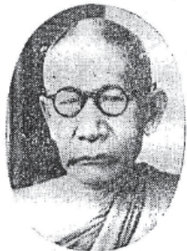
សម្តេចព្រះមហាសុមេធាធិបតី ដាតញ្ញាលោក ជួន.ណាត Samdach Prah Maha sumedhadhipadey « chuon-Nath »