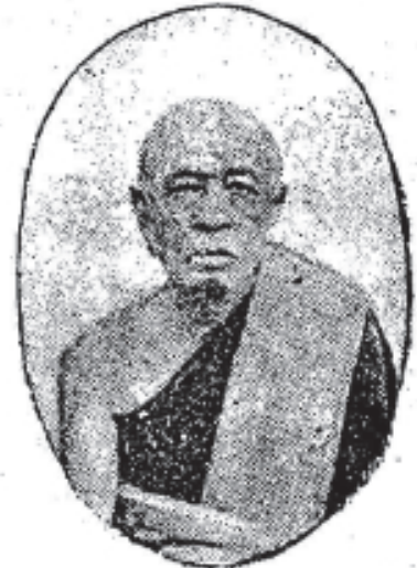
សម្តេចព្រះមង្គលទេព្វបាវ ភទ្ទគូ “អៀម” Samdach Prah Mongkuldebachar “ Eim ”