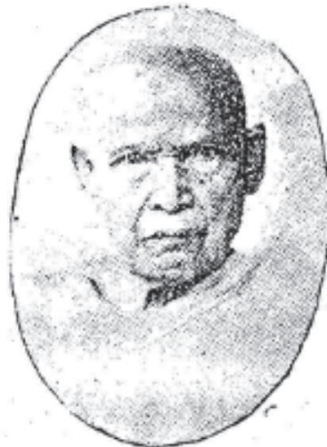
សម្តេចព្រះសុធិរាជិបតី ពុទ្ធនាគោ “អុង-ស្រី” Samdach Prah Sudhammadhipadey “ Ung Srey ”