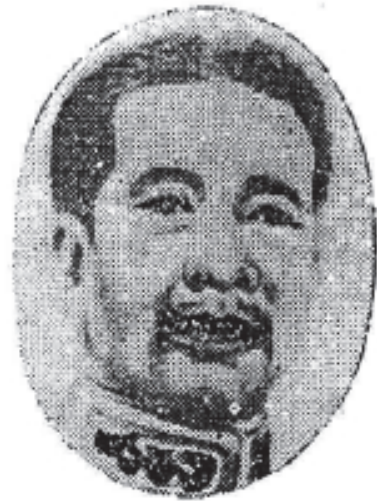
ព្រះបាទសម្តេចព្រះស៊ីសុវត្ថិមុនីវង្ស Prah Sisowath Munivong