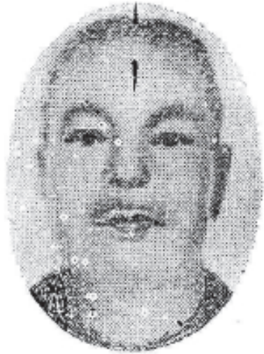
ព្រះបាទសម្តេចព្រះហរិរក្សរាមា ព្រះអង្គឡុង Prah Ang Duong