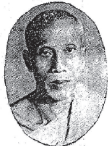
សម្តេចព្រះសុធិរាជិបតី ភិក្ខុញ្ញាណ “ភូល-ទេស” Samdach Prah Sudhammadhipadey “Phoul-Tes”