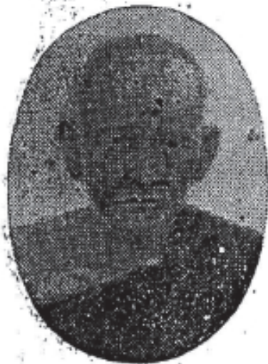
សម្តេចព្រះមហាសុមេធាធិបតី បក្ក.ត្រៃ.ហ៊ុន Samdach Prah Maha Sumedhadhipadey «Prak-Hin»