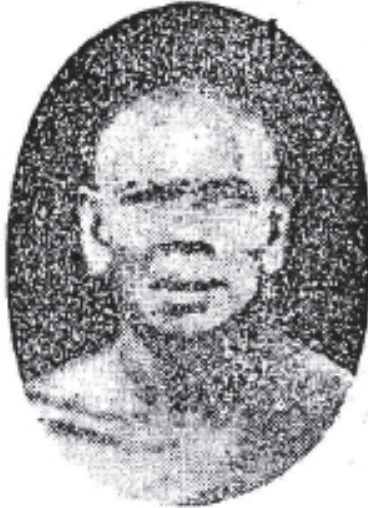
សម្តេចព្រះសុធិរាជិបតី បញ្ញាសីលោ “ប៉ាន” Samdach Prah Sudhammadhipadey “ Pan ”

CHIEF OF DHAMMAYUTHI ORDER, from origin to present time