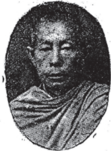
ព្រះមហាព្រះប្បមុនី “អ៊ូ”

វត្តឧណ្ណាលោម អគ្គិយសិបតិរង នៃក្រុមជំនុំប្រែព្រះត្រៃបិដក Prah Uttamamuni « Oun-Sou »