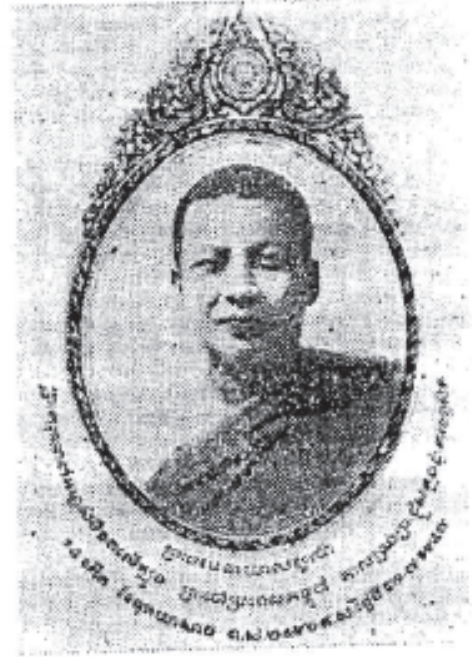
ព្រះបាទសម្តេចព្រះនរោត្តមសីហនុវរ្ម័ន កាលទ្រង់ព្រះផ្លូវ King Sihanouk as Buddhist monk