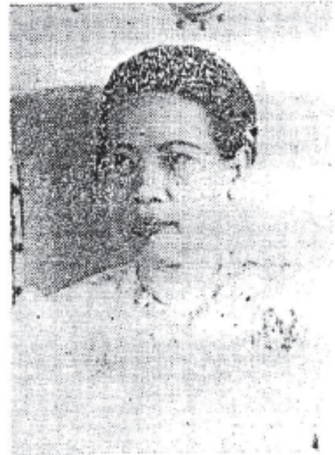
សម្តេចព្រះមហាក្សត្រីយានី Prah Moha Kossamak