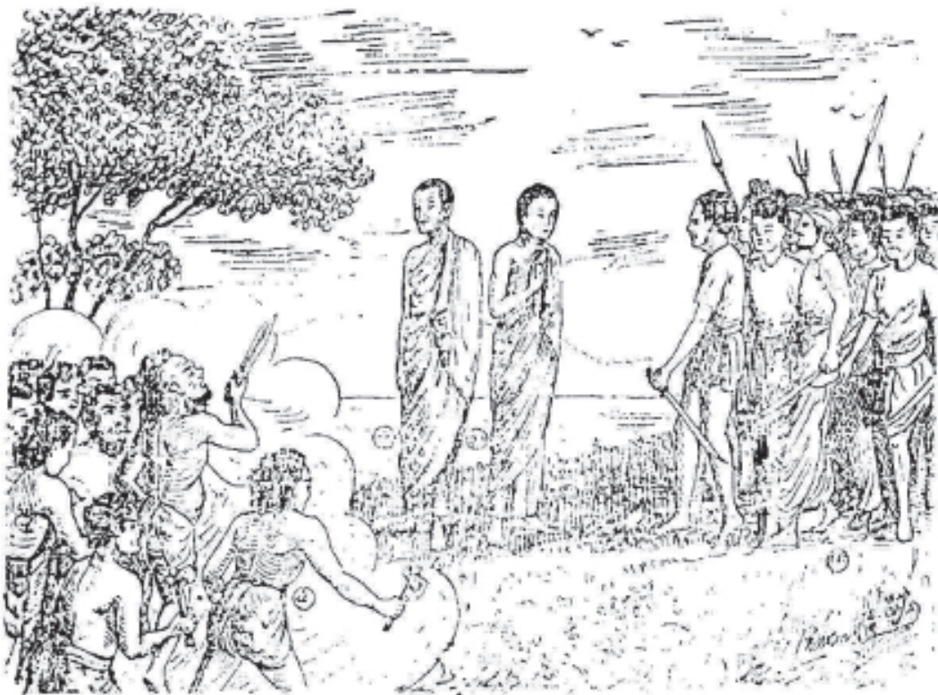
ព្រះសោណត្រូវនឹងព្រះឧត្តរត្រៃមេកនិលសវណ្ណភូមិ The first arrival of Buddhist Mission to Sovannabhumi.