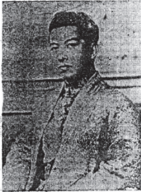
ព្រះបាទសម្តេចព្រះនរោត្តម សីហនុ វរ្ម័ន Prah Norodom Sihanouk