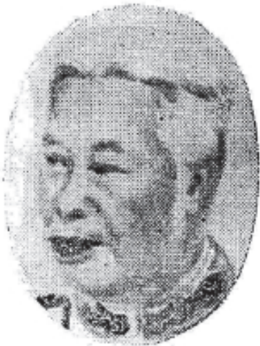
ព្រះបាទសម្តេចព្រះស៊ីសុវត្ថិ Prah Sisowath