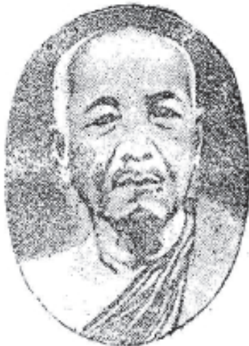
សម្តេចព្រះមង្គលទេព្វបាវ បញ្ញាទីលោ “ស៊ុក” Samdach Prah Mongkuldebachar “ Souk ”