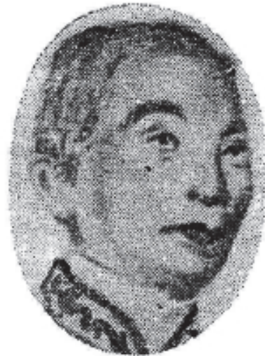
ព្រះបាទសម្តេចព្រះនរោត្តម Prah Norodom