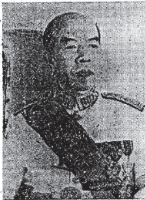
ព្រះបាទសម្តេចព្រះនរោត្តមសុរាម្រឹត Prah Norodom Suramarith