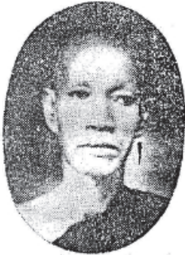
ព្រះវិមលធម្ម “ថោង”

វត្តឧណ្ណាលោម ជាសាស្តាចារ្យ ឯកទានបង្រៀនព្រះត្រៃបិដកជាន់ ដើម ។ Prah Vimalatham « Thong » (deceased)