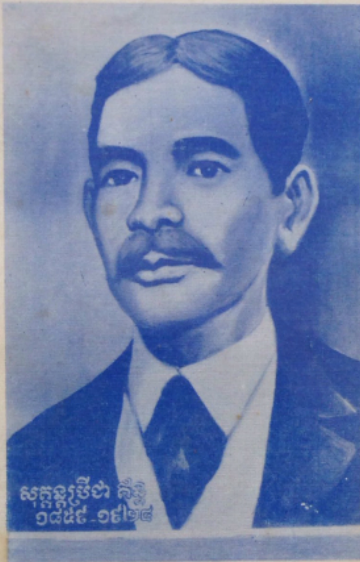
សុត្តន្តបិដក គីឡូ ១៨៥៩-១៩១៤