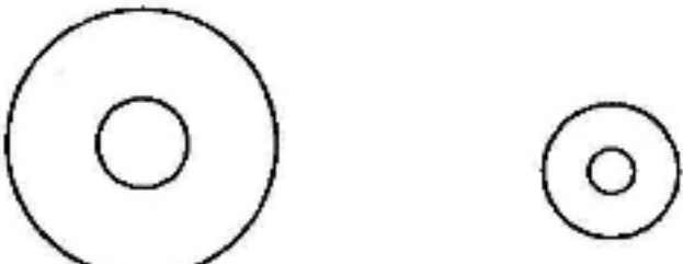
រូបភាពទី២

ចក្ខុរបស់លោកអ្នកនឹងរាយការណ៍មក ឱ្យលោកអ្នកថា រយៈខ្សែអូសពីអក្សរ (ក) ដល់ (ខ) នោះខ្លីជាងរយៈពី (ខ) ដល់ (គ) ប៉ុន្តែខ្សែអូសទាំងពីរនេះវែងប្រវែងគ្នា ប្រសិនបើមិន ជឿសូមវាស់មើលចុះ ។