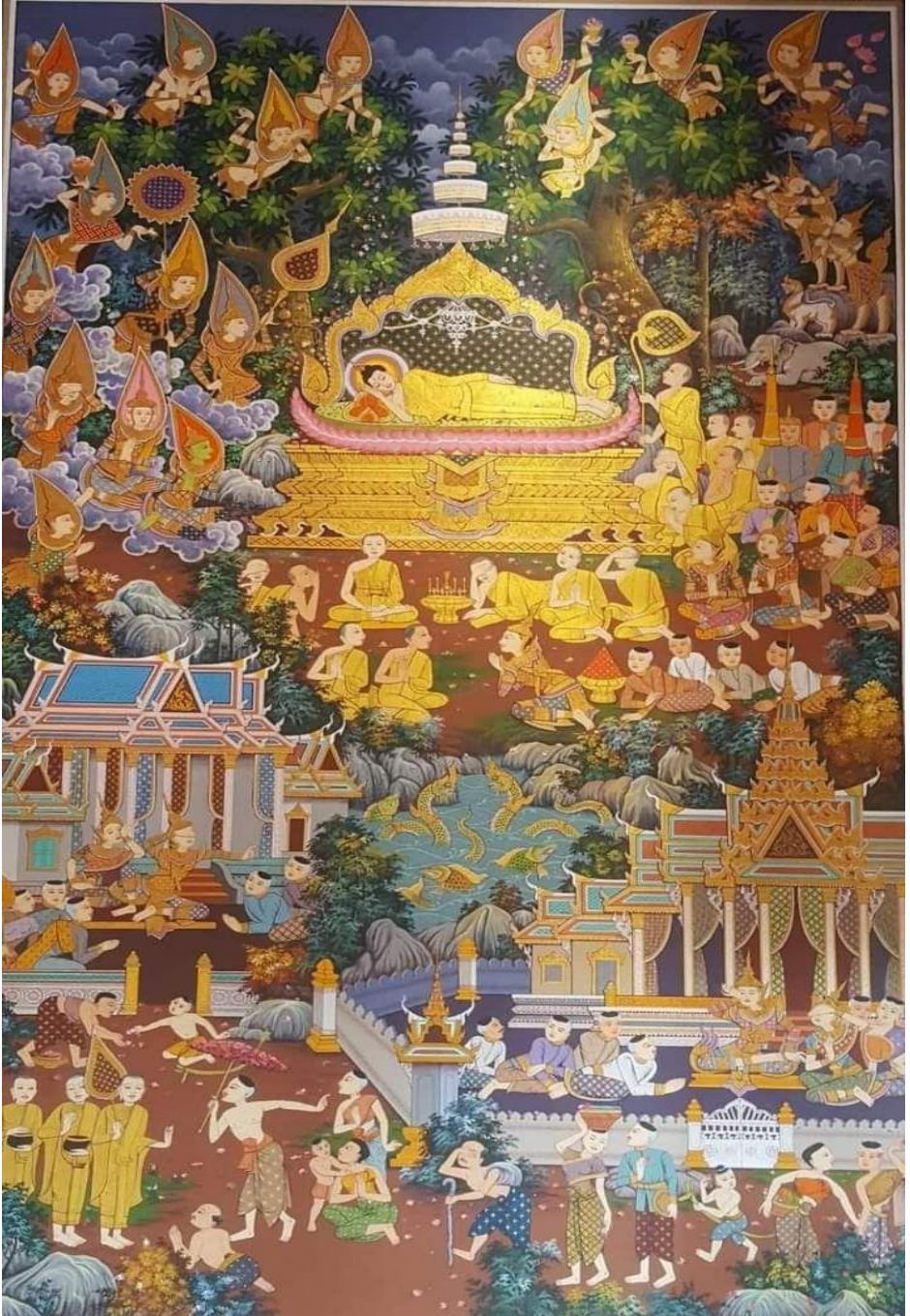
ព្រះអង្គបរិនិព្វាន