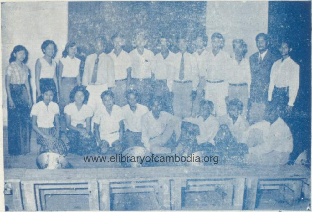
នេះគឺជារូបថតនៃវិទ្យុក្រសួងមួយដែលបិទទំនងមាតាមាននាមថា “សិស្សៈល្ងា ឆ.” ។ របៀបថតរួមផ្ទះសសេចក្តីឲ្យ ឃើញថាសមាជិកវិទ្យុក្រសួងដ៏ធំនេះរាប់អានស្រឡាញ់គ្នា មិនគិតជាឯករាជ្យស្រឡាញ់រវាងបងប្អូនបង្កើតឡើយ ។