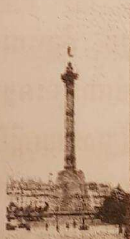
៩៩ឆ្នាំក្រោយមក ឆ្នាំ ១៧៨៨ 99ans plus tard, Batslle en 1988