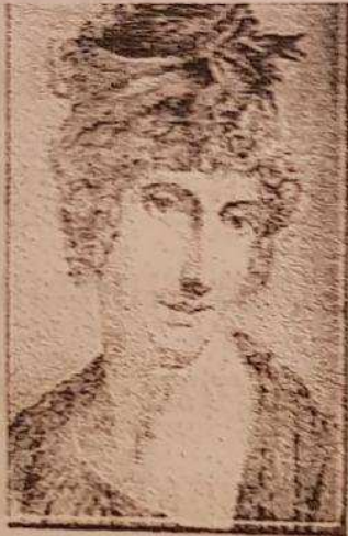
ម៉ារី អូឡាំព ដឺគូ Marie-Olympe d Gouges

ខ្ញុំព្រះករុណា ខ្ញុំ សូមអរព្រះគុណ សូមអរគុណ ។