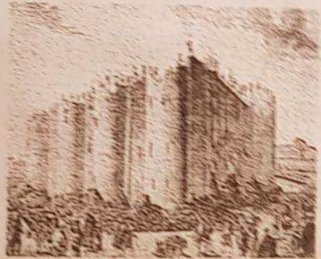
ពន្ធនាគារ បាស្ទ័យ ឆ្នាំ ១៧៨៩