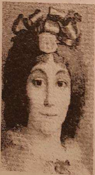
តេរ៉ូញ ដឺ មេរីគូរ Théroigne de Méricour