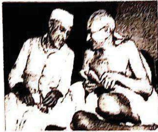
លោក ហាវហាឡាល់ ទេរុ និង លោក មូហង់មាស ការីចន្ទ តួងឌី (១៨៨៩ - ១៩៦៤) (១៨៦៩ - ១៩៤៨)