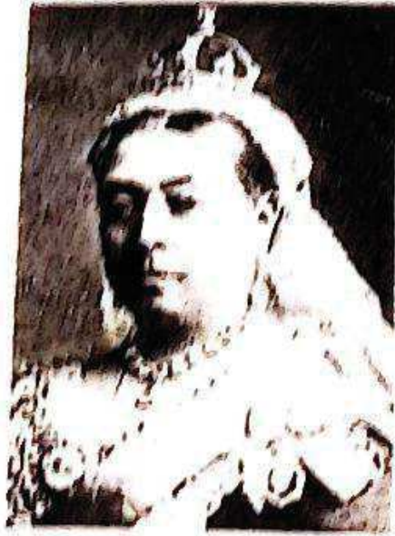
មហាក្សត្រីយានី វិច្ឆិយា (១៨១៩ - ១៩០១)