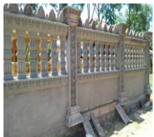
សេចក្តីអំពាវនាវ

ខ្ញុំព្រះករុណា អាត្មាកាព យើងខ្ញុំទាំងអស់គ្នា ចៅអធិការ អាចារ្យគណៈកម្មការ សម្រាប់វត្តដំបូរីនប៉ោយសំរោង ឃុំតាពូង ស្រុកថ្មគោល ខេត្តបាត់ដំបង ។ សូមធ្វើការអំពាវនាវ ដល់ព្រះតេជគុណ ពុទ្ធបរិស័ទក្នុង និងក្រៅ ប្រទេស មានសទ្ធាជ្រះថ្លា ដើម្បីចូលរួមចាប់មគ្គផល ក្នុងការចូល រួមកសាងរបងវត្ត មួយប្រឡោះ ៣០០ដុល្លារ ។ ទំនាក់ទំនងទូរស័ព្ទ (+៨៥៥)១២ ២៨៤ ៥២៧