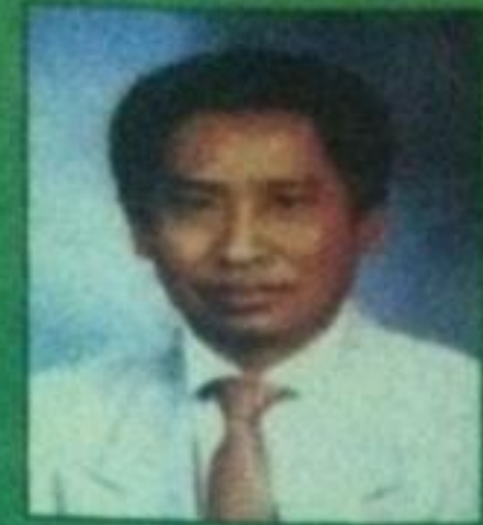
វិច ជាន់សុដ្ឋន

សៀវភៅ "ព្រះសមណគោតម" ទំព័រ៣៣៣នេះបញ្ជាក់ខុស៖