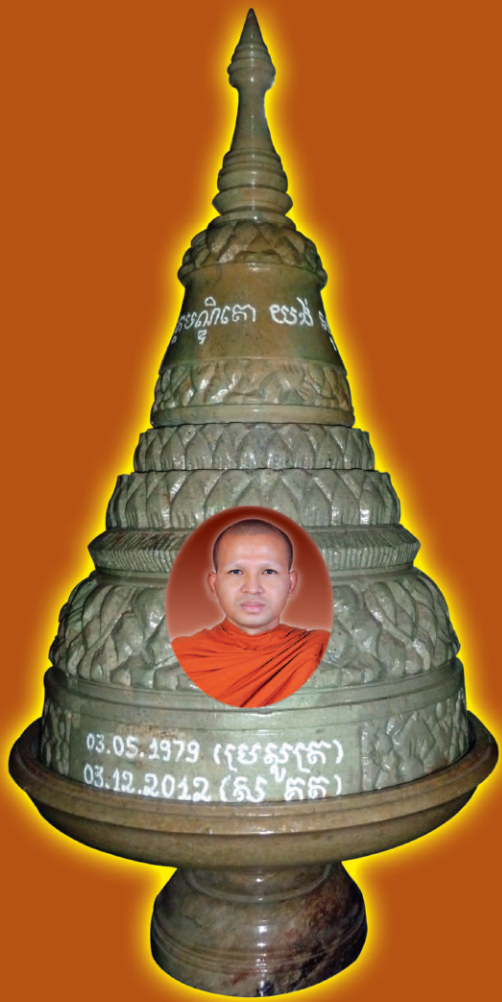
ផ្សព្វផ្សាយដោយសមាគមធម្មទានអរិយវង្សយង់សុផាត